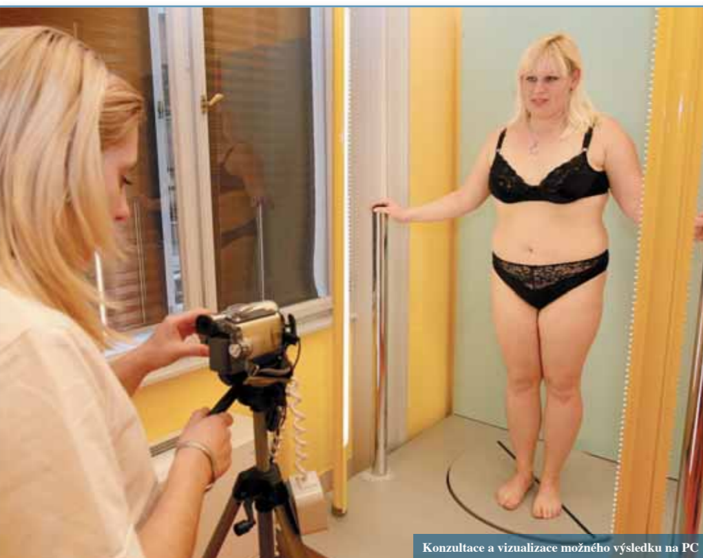
Konzultace a vizualizace možného výsledku na PC