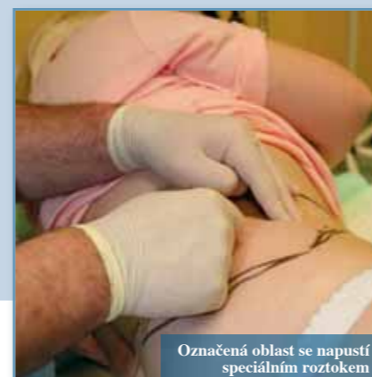
Označená oblast se napustí speciálním roztokem