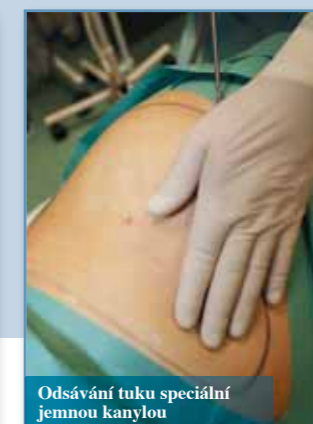
Odsávání tuku speciální jemnou kanylou