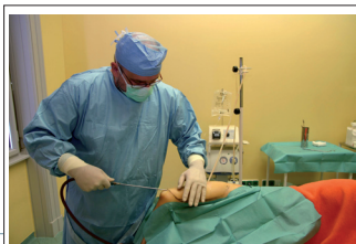
průběh liposukce je bezbolestný

Po operaci je potřeba 14 dní nosit speciální elastické návleky, díky kterým vaše kůže nezůstane povislá a rychle si zvykne na menší objem paží. Také je potřeba dodržovat několik dní klidový stav, tedy nosit těžká zavazadla a třeba nesportovat, aby nenastaly nějaké pooperační komplikace, například lehké krvácení.